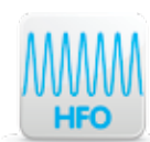
High Frequency Oscillation