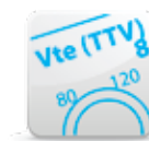
Targeted Tidal Volumes