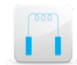
Hot Wire Flow Sensor